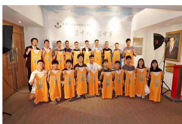
三十周年校慶：傑出校友座談會