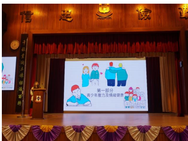
正向管教家長講座

學校透過在家長日及家教會周年會議安排情緒管理、正向管教、靜觀等相關工作坊，加強家長對壓力處理的認識。同時，家教會積極推動不同類型的親子工作坊及活動，除了連結學校與家長外，亦增進家校之間的交流。此外，透過家教會活動、推介教育局及坊間有關正向管教子女的家長講座，讓家長獲得有關正向教育的資訊並學習正向管教子女的方法。