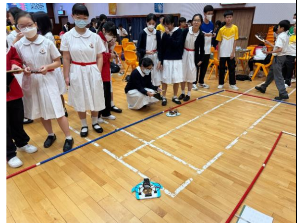
Micro bit 氣墊船模型體驗課程