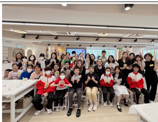
家教會花花啫喱工作坊