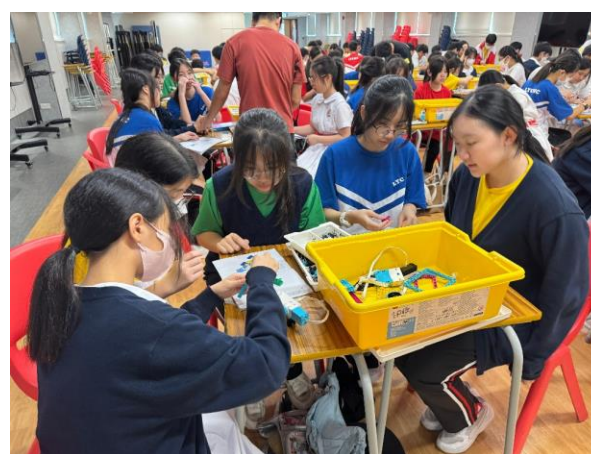
Lego Education Code Program