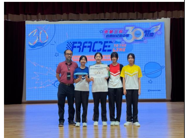
火箭車模型體驗課程