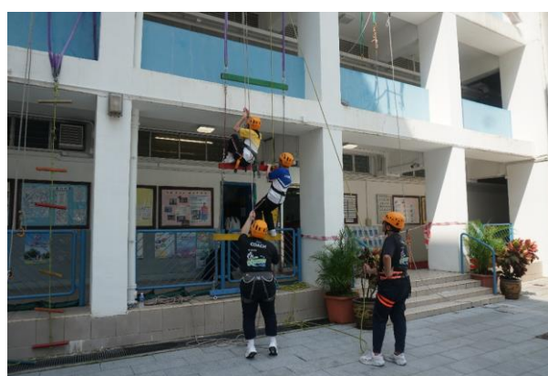
三十周年校慶：校慶歷奇體驗