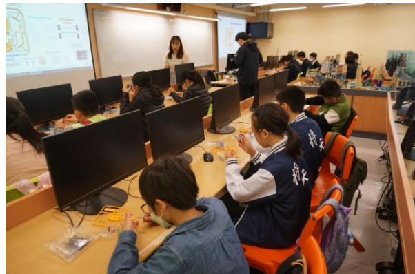
三十周年校慶：嘉年華 STEM 工作坊