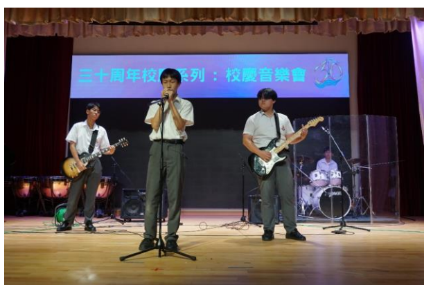
三十周年校慶：校慶音樂會

來到周期的第3年，不少的課程及科組活動已逐漸恆常化及常規化。學校不同科組舉辦不同活動以培養學生「正面情緒」、「良好關係」、「全心投入」、「意義人生」及「滿有成就感」等五項正向元素。例如德育及公民教育委員會透過校園電視台，以手冊的名人諺語為題，製作節目向學生分享名人諺語及正面價值觀，提升學生的正向情緒。而訓導委員會則參與賽馬會網絡「謊情識」計劃，透過不同的學生教育活動使學生在人際關係及對學校的態度更加正面、對校園的欣賞及感恩文化有所加強。而輔導委員會透過正向教育講座、舒壓活動、情緒工作坊、藝術治療小組及教育局「守護大使」計劃等，有效識別及幫助有情緒需要之學生，並培養學生正面情緒和正面價值觀，提升學生正面思維及逆境力。而學生支援委員會及課外活動委員會善用學習支援津貼(LSG)和全方位學習津貼(LWL)等津貼，舉辦興趣班或工作坊讓學生接觸不同技能、體驗職場環境，確立其自我價值及學懂如何釋放負面情緒，學習以積極正面的態度去欣賞自己和處事。同時，為配合本學年的30周年校慶，課外活動委員會亦積極於試後活動組織不同的活動，讓學生有更多元化的體驗及展現才能的機會，例如：三十周年校慶：中華文化體驗日、校慶歷奇體驗及校慶音樂會等，亦有連同升學及就業輔導委員會及校友會組織不同的三十周年校友活動，加強校內學生以致畢業校友對學校的聯繫感。