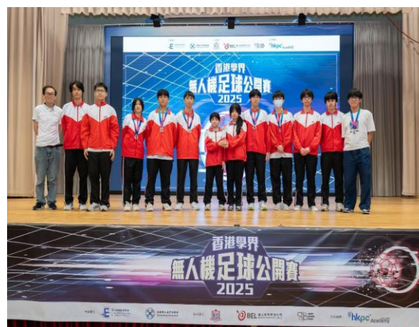
2025 年香港無人機足球公開賽